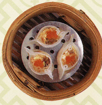
魚翅鳳眼餃 フカヒレ蒸し餃子 Steamed prawn and shark's fins dumplings