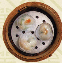
龍皇帶子餃 帆立貝入り蒸し餃子 Steamed scallop and vegetable dumplings