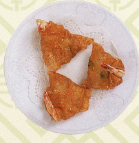
腐皮鳳尾蝦 海老の湯葉巻き揚げ Deep fried wonton wrapped in bean curd skin