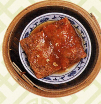
竹筴上素卷 キヌガサタケ入り 五目野菜の湯葉包み蒸し Steamed bamboo pith rolls stuffed with mixed mushrooms