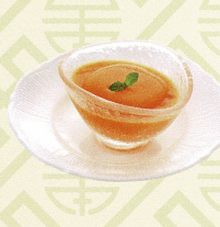
芒果布丁 マンゴープリン Fresh mango pudding