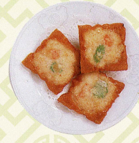
百花炸多士 海老すり身のせトースト Deep fried minced prawn on toast