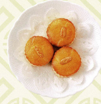
雲腿金錢酥 金華ハムと海老入りパイ Kim wa ham and shrimp pie