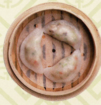
羅漢齋粉菓 キヌガサタケ入り 精選野菜の蒸し餃子 Steamed mixed vegetable dumplings