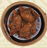
姜葱牛肉角 牛肉入り餃子の葱生姜蒸し Steamed beef dumplings with ginger and leek