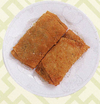
韭黃煎竹卷 黄ニラ入り湯葉の煎り焼き Deep fried bean curd skin rolls with chives