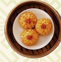
金粟百花球 海老すり身のスイートコーン包み蒸し Steamed minced prawn ball with corn