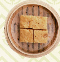
古法馬拉糕 蒸しカスタード Steamed sponge cake