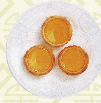
鮮奶雞旦撻 プリンタルト Freshly baked egg tarts