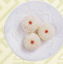
椰蓉糯米糍 ココナッツともち米の団子 Sweet glutinous balls with shredded coconut