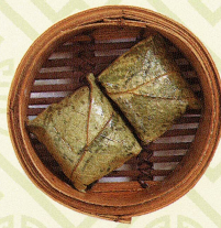
瑤柱珍珠雞 ちまき Lotus leaf wrapped sticky rice