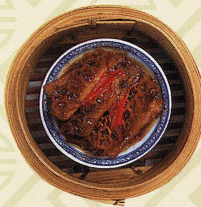
沙爹金錢肚 ハチの巣(牛胃袋)の サテースソース蒸し Steamed tripe in satay sauce