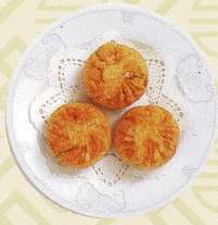
生煎韭菜餅 ニラ入り揚げもち Pan fried chives and vegetable dumplings