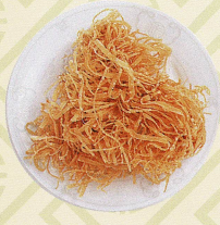
鵲巢焼肉丸 三種挽き肉揚げ団子 Deep fried minced pork balls