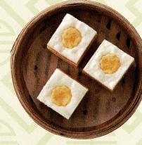
蛋黃千層糕 カスタードクリーム入り 重ね蒸しカスタード Steamed custard layered sponge cake