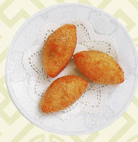
安蝦咸水角 海老入りもち米の揚げ餃子 Deep fried glutinous dumplings with prawn and vegetables