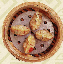
蟹肉魚翅餃 蟹肉入りフカヒレの蒸し餃子 Steamed crab meat dumplings with shark's fins