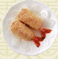
香麻千層蝦 海老と金華ハム入り胡麻風味パイ Shrimp and kim wa ham pie with sesame seeds