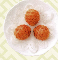
奶皇箭豬仔 カスタード入りはりねずみの揚げ饅頭 Deep fried hedgehog shaped custard buns