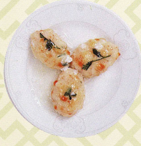
香煎琵琶翅 フカヒレと海老すり身の 琵琶型焼き Pan fried minced prawn with shark's fins