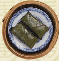
XO米沙雞 鶏肉のXO醤蒸し Steamed chicken with XO sauce wrapped in lotus leaf