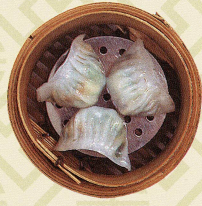
蝦容韭菜餃 海老とニラ入り蒸し餃子 Steamed prawn and chives dumplings