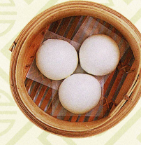
蛋黃蓮蓉飽 卵黄と蓮のの実のあん入り蒸し饅頭 Steamed bun with sweetened lotus seed paste