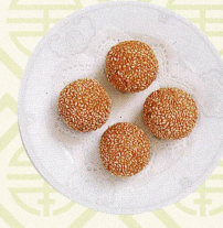
脆皮芝麻球 蓮のの実のあん入りごま揚げ団子 Deep fried sesame balls with lotus seed paste