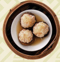
魚翅釀北菇 挽き肉の椎茸詰め蒸しフカヒレのせ Steamed mushroom stuffed with minced meat