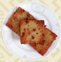
腊味蘿蔔糕 大根餅煎り焼き Pan fried radish cakes