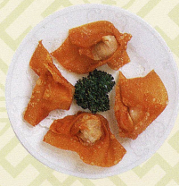
五柳炸雲吞 揚げワンタンの甘酢かけ Deep fried wonton with sweet and sour sauce