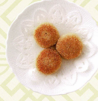
香麻煎軟糰 蓮のの実のあん入り煎り餅 Deep fried sticky sesame cake with lotus seed paste