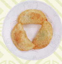
上湯煎粉菓 揚げ餃子の上湯スープ添え Deep fried vegetables and prawn dumplings with stock