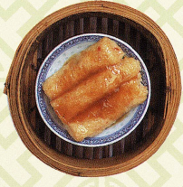
蠔油鮮竹卷 挽き肉の湯葉包み牡蠣ソース蒸し Steamed bean curd skin roll with pork meat in oyster sauce